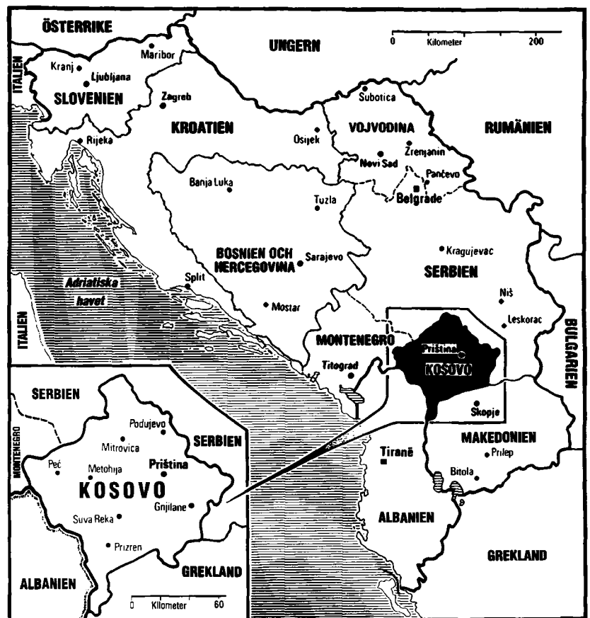
Karta enligt underlag från Conflict Studies. oktober 1989