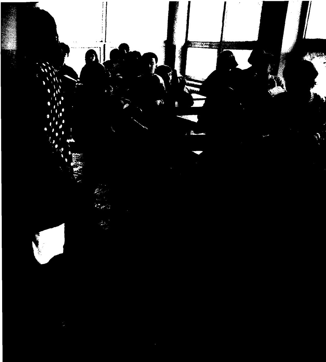
Pråk och albanska utbildningsinstitutioner inrättades på alla nivåer.