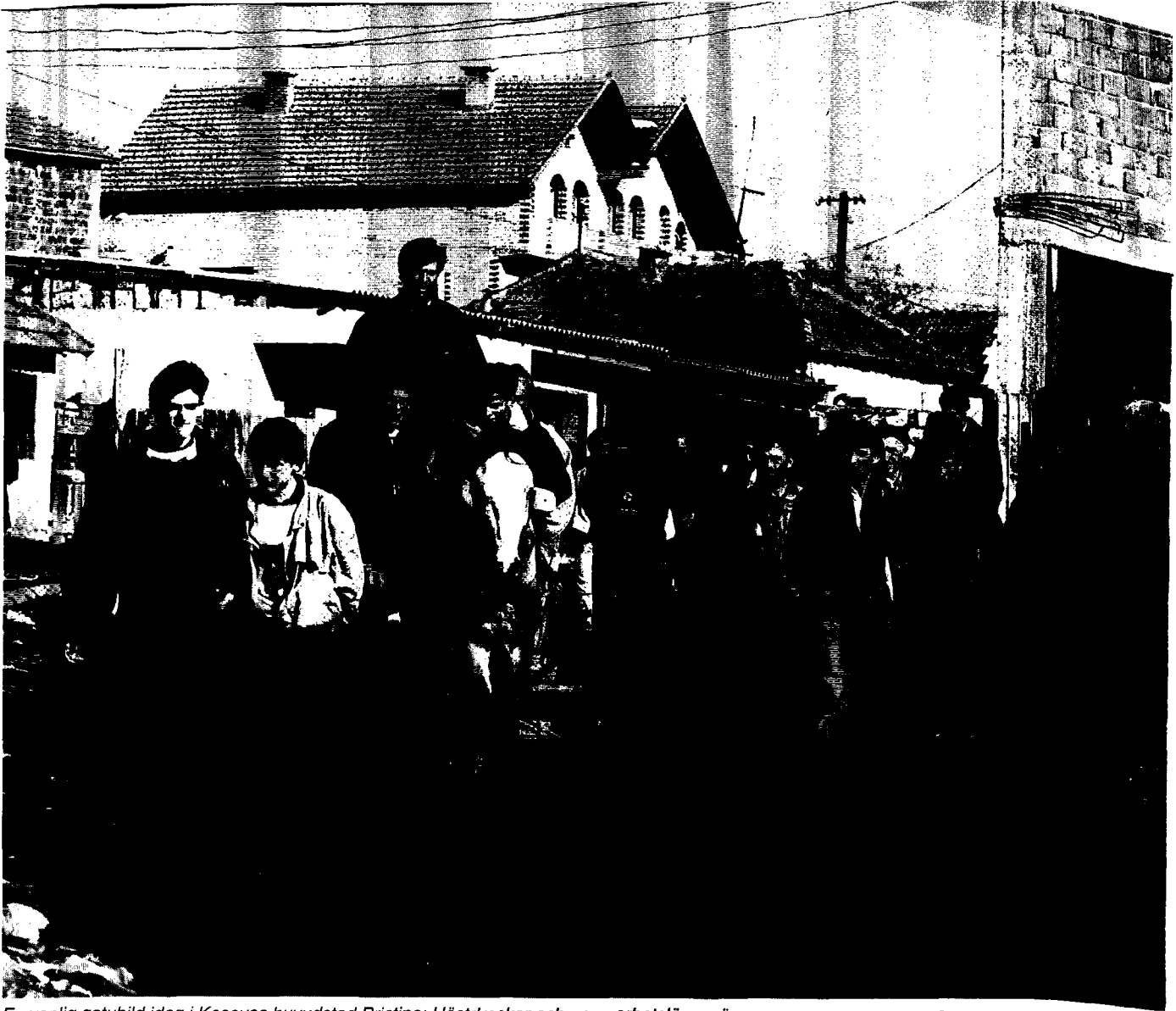
En vanlig gatubild idag i Kosovos huvudstad Pristina: Hästdroskor och unga arbetslösa män.