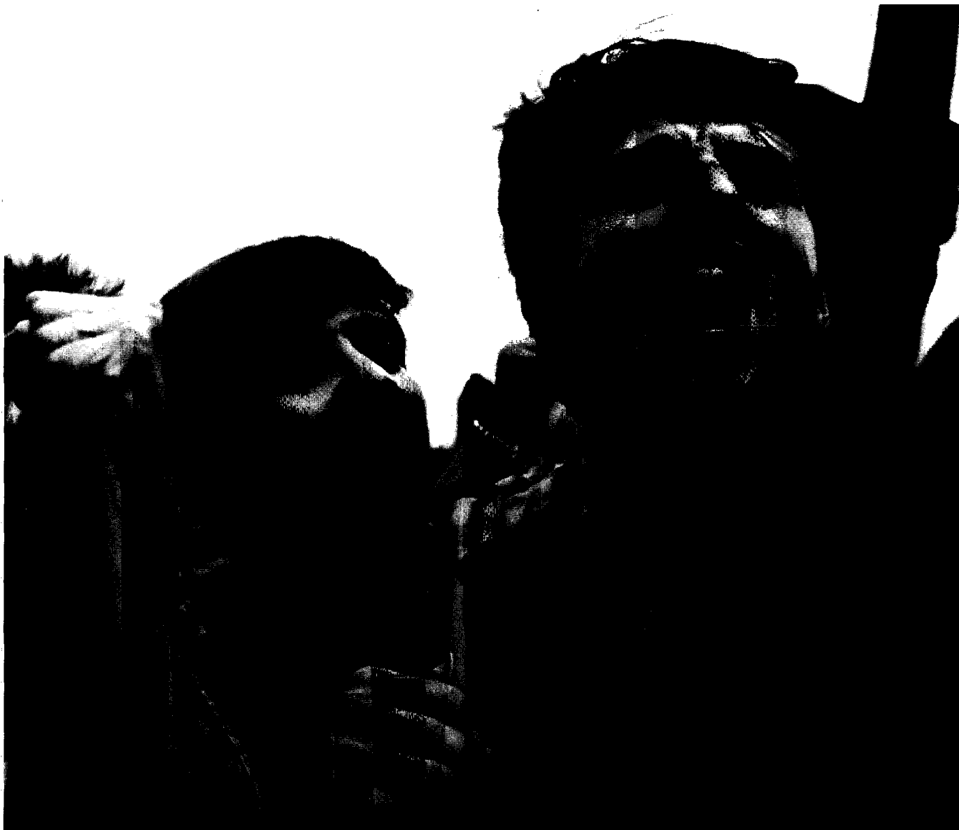
Våldsamma demonstrationer av serber vid Kosovo polje 1987 för ett serbiskt Kosovo.