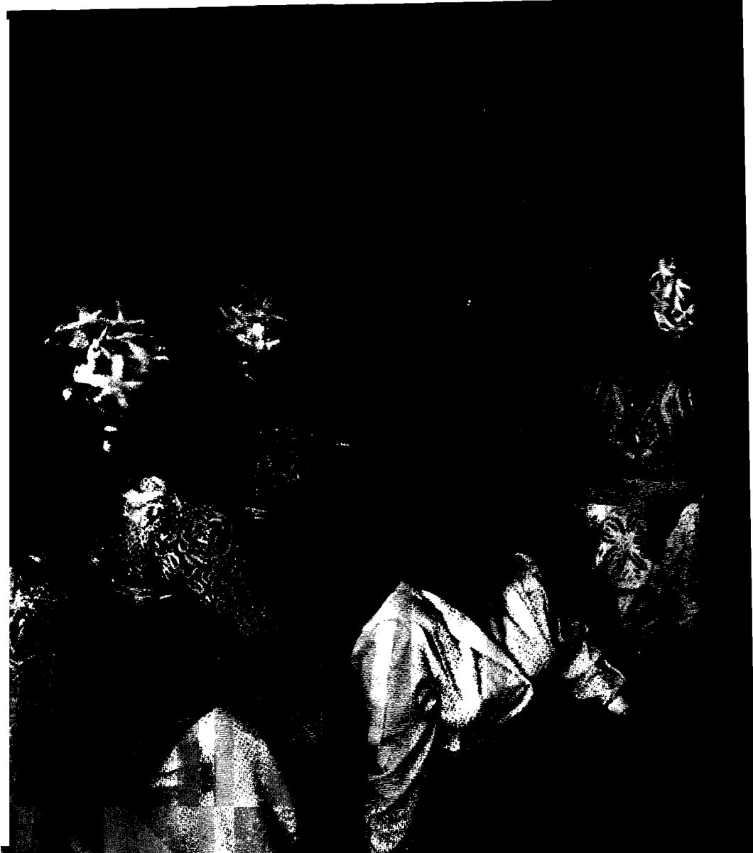
Albanskt muslimskt bröllop enligt gammal turkisk tradition. Bruden ska inte lyfta blicken från marken -

I delar av Kosovo och Makedonien förekommer det att muslimska (albanska) föräldrar inte skickar flickorna till grundskola eller gymnasium, men väl till koranskolan. Exakt hur många det rör sig om är svårt att avgöra. Vanligen talas om att grundskolan i Kosovo täcker 90 procent av alla barn i skolåldern, vilket