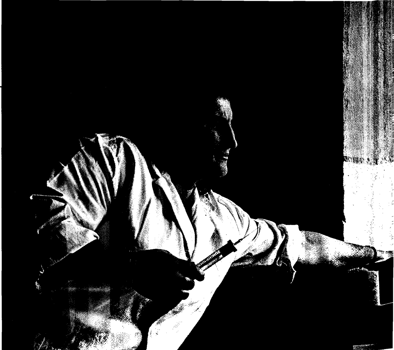
Sjuksköterska i albansk by. Hon var den första flickan i byn som fick utbildning.