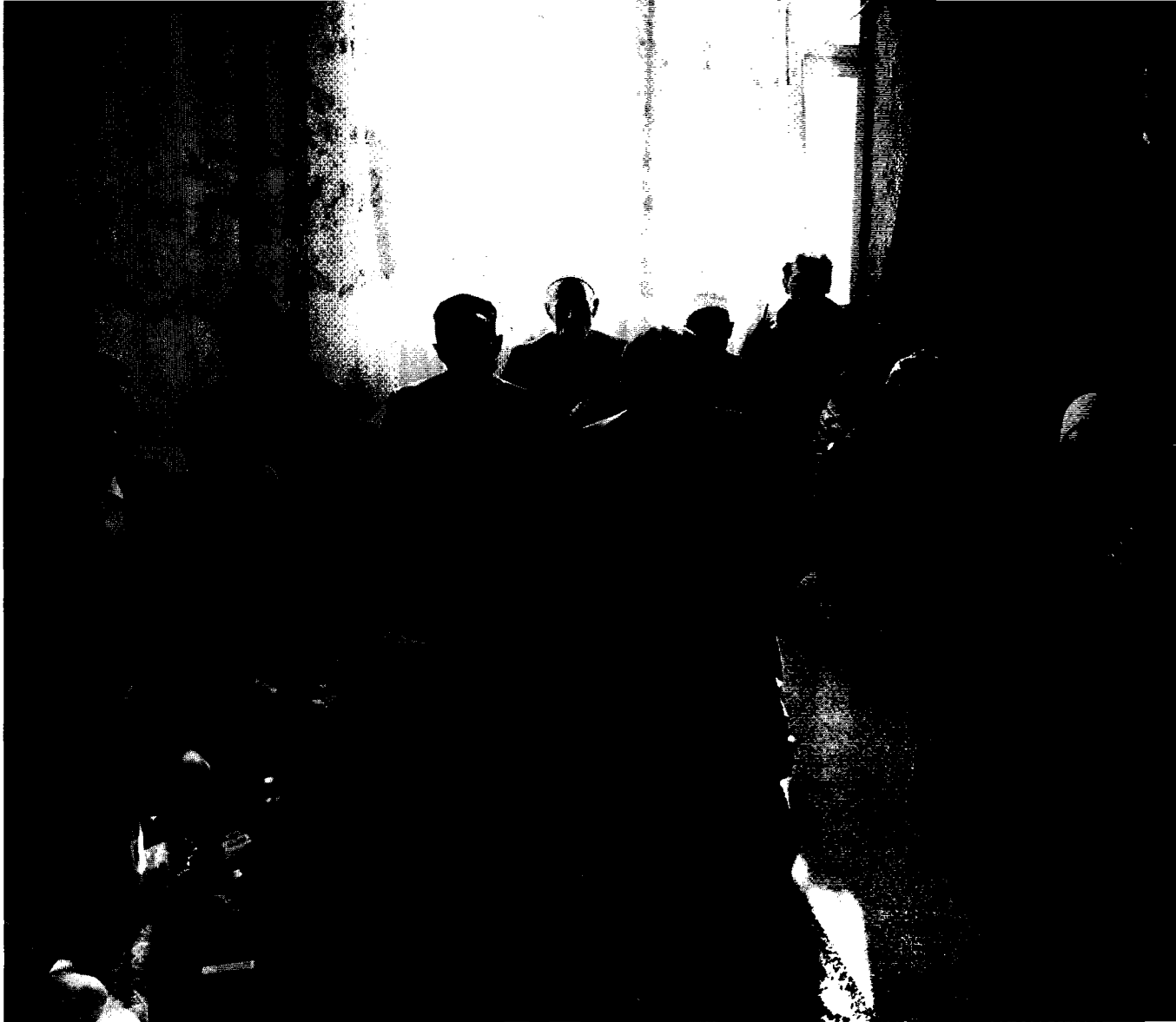
Samlade för att hedra minnet av en död granne och vän. Merparten av de albanska muslimerna håller sig till religionens bud och deltar regelbundet i gudstjänstlivet.