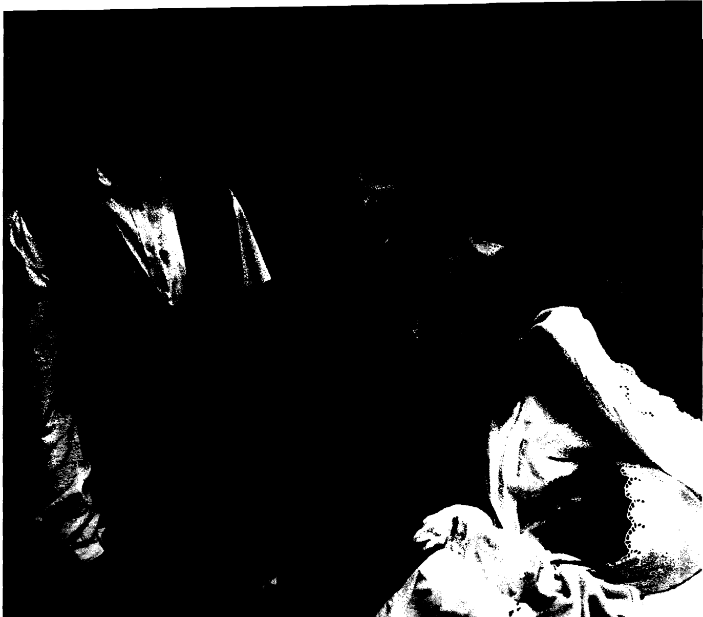
Nativiteten i Kosovo är traditionellt hög, och stoltheten inför varje nytt barn är stor.