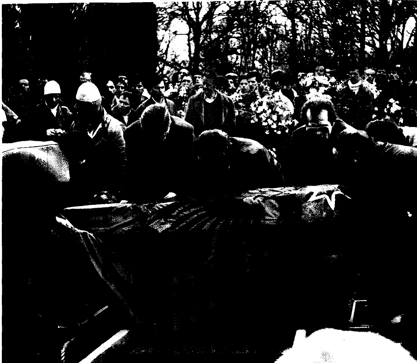
April 1990. Han ville se Kosovo som en självständig republik. Vid begravningen är kistan inlindad i en flagga med den albanska trehövdade örnen som minner om Albaniens hjälte Skanderbeg.