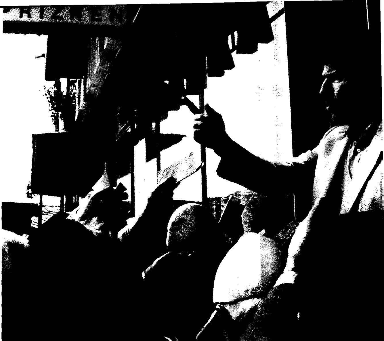
Den ekonomiska situationen är katastrofal, med en extrem inflation. Här köar albaner för att snabbt få ut kontanter från banken innan inflationen åter upp kapitalet.