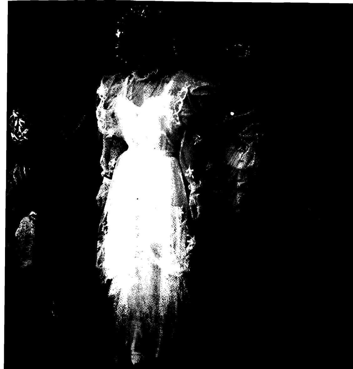
arken – hon visar att hon sörjer över att lämna sitt föräldrahem.