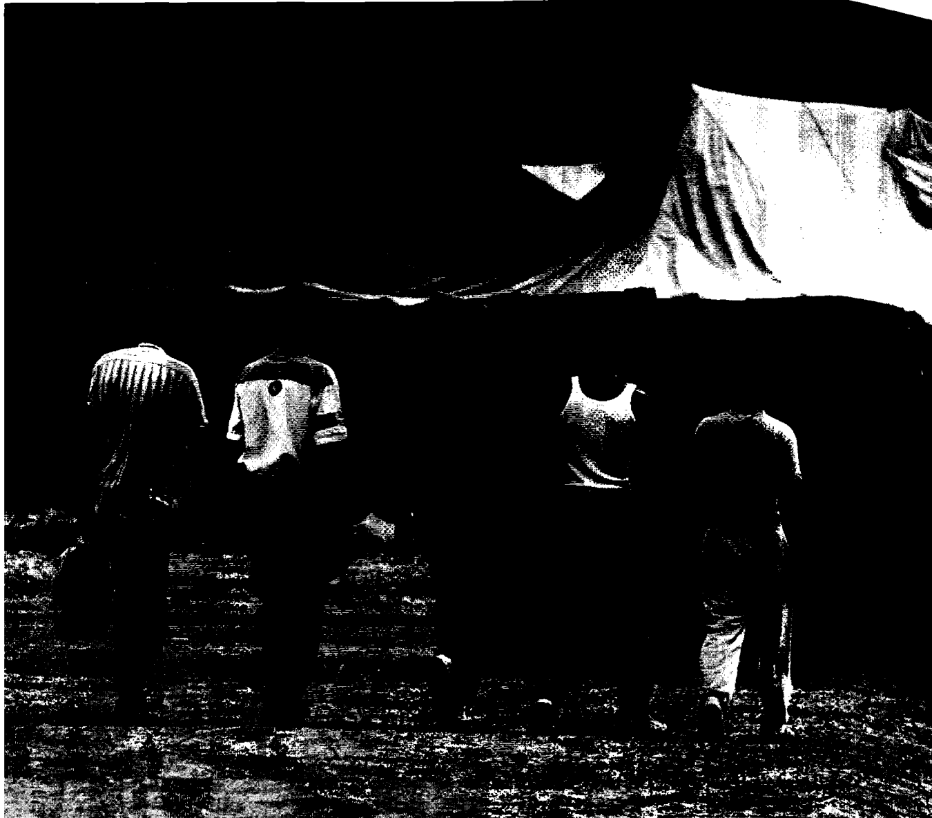
Sommaren 1992 kom ca. 30.000 albansktalande som asylsökande till Sverige. Detta medförde ett ibland mycket provisoriskt boende. Den 10/10-92 infördes visumtvång för medborgare i f.d. Jugoslavien (republiken Serbien-Montenegro med provinserna Kosovo och Vojvodina).