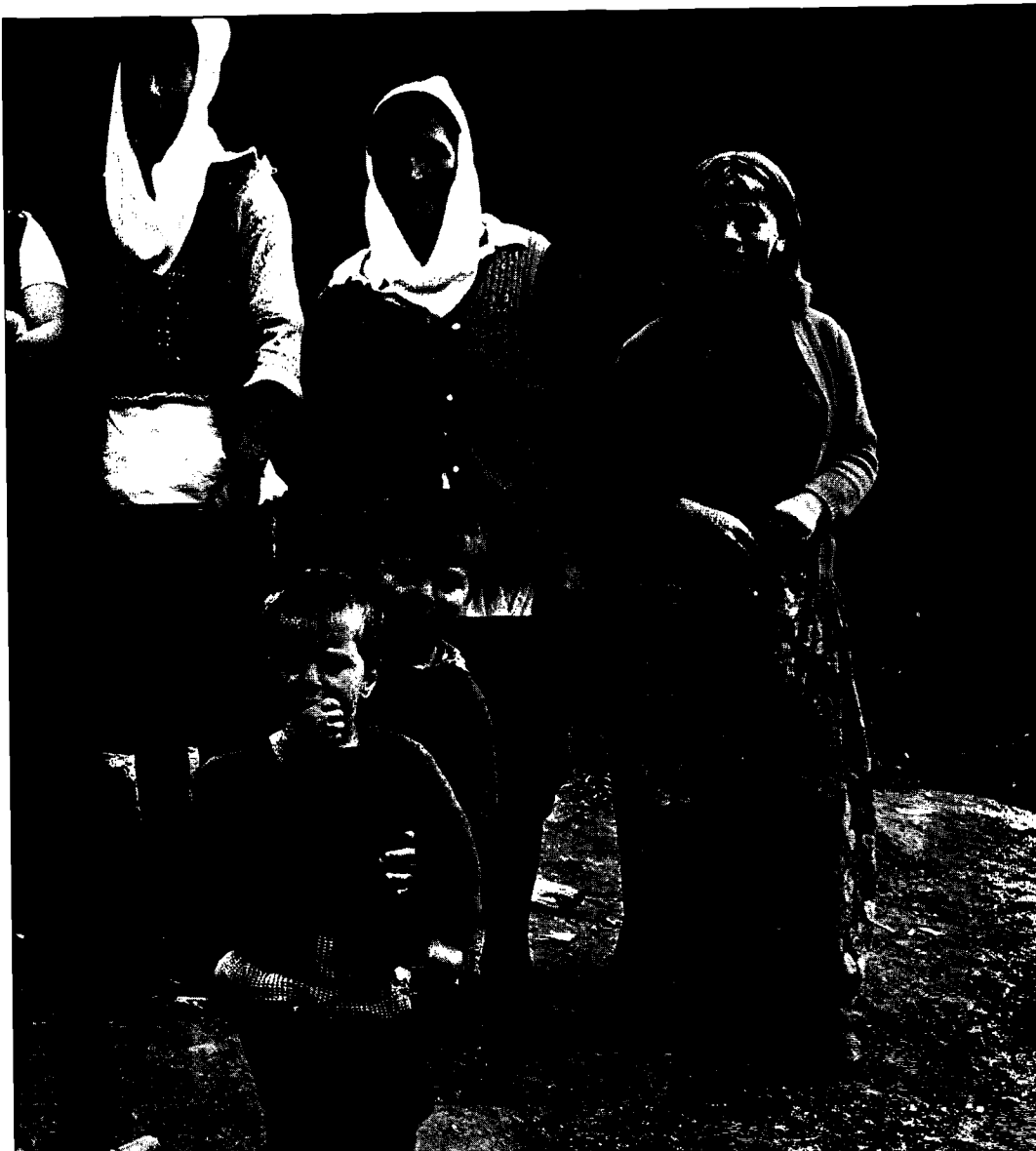
...bit fr... % till 25% av befolkningen i Kosovo.