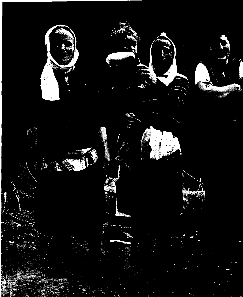
Kvinnorna i en albansk storfamilj samlade under fåbodriften. Andelen jordbrukare har på trettio år sjunkit

De ekonomiska och sociala förhållandena i Kosovo ledde till häftiga diskussioner bland jugoslaviska politiker och samhällsvetare. Ekonomer och politiker från Serbien och Makedonien menade att det mot bakgrund av situationen i Kosovo hade varit naturligt att organisera ett omfattande barnbegränsningsprogram. Från albansk sida visade man inte något större intresse för familjeplanering, utan hävdade i stället att nativiteten automatiskt skulle sjunka som en naturlig följd av den ekonomiska utvecklingen. Man pekade bl.a. på att födelse-talen var lägre bland kvinnor med högre utbildning. Enligt